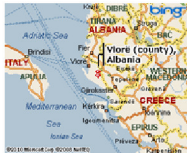
Vlora (stad in Albanië)