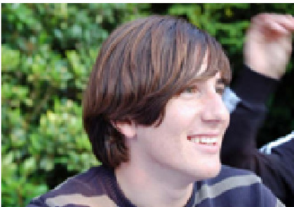
Een gelukkige Izmir