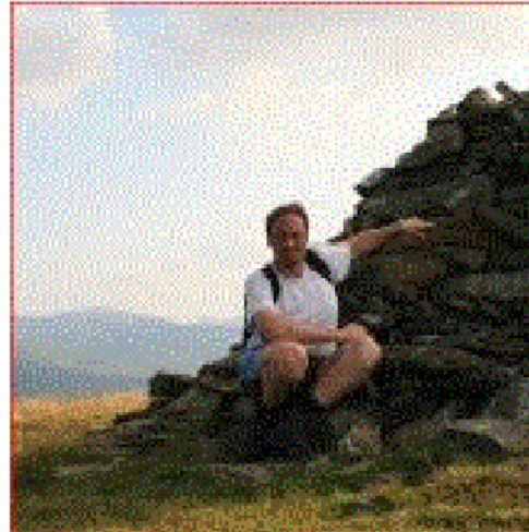
Mr Sey op een rustig moment